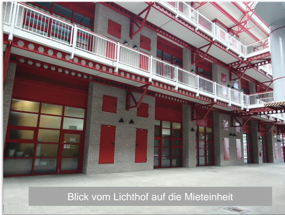
Foto der Mietfläche Q76-77