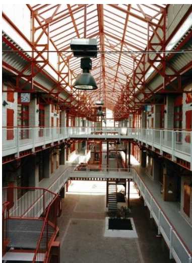
Blick in den Lichthof eines unserer Häuser

Ob Büro, Werkstatt, Fertigungsfläche, Versuchsfeld oder Schulungsraum – das IGZ Magdeburg bietet innovativen Unternehmen aus nahezu allen Branchen gute Entfaltungsmöglichkeiten.